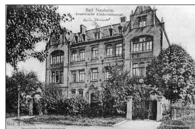
Children's Sanatorium in Bad Nauheim

This home was established to heal people with lung diseases.