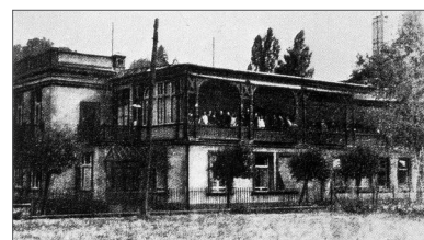
Health-Resort in Bad Soden

The Great Lodge Conference took place in Frankfurt am Main on May 2, 1896. The foundation stone was laid here for the future Centre for Jewish Welfare Work. The Lodge received great praise for its assistance of many social establishments as well as for awarding scholarships to students.