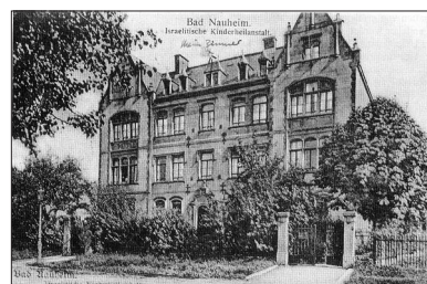
Kinderheilstätte in Bad Nauheim