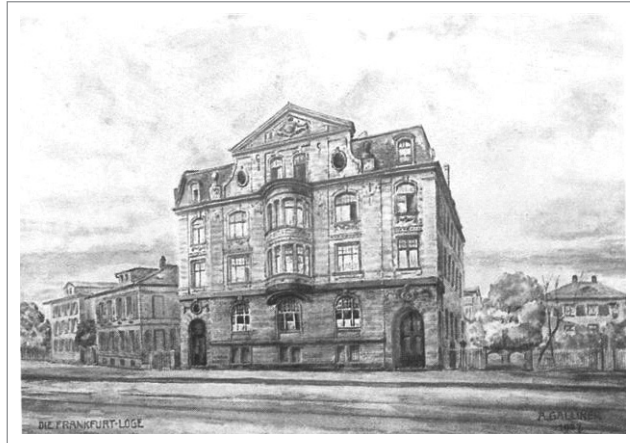
Altes Logen-Haus 1902-1937 Eschersheimer Landstraße 25-29 • Frankfurt

B'nai B'rith Frankfurt Schönstadt Loge • Liebigstraße 24 • 60323 Frankfurt